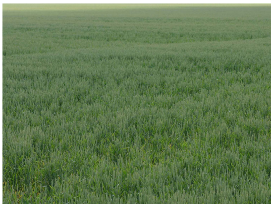
Billede 2. Pletter i hvedemark med angreb af hvededværgvirus.