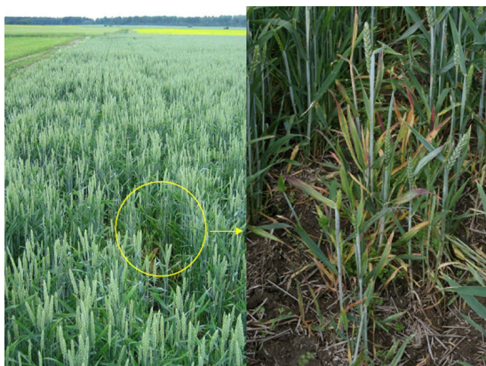
Billede 3. Hvededværgvirus.