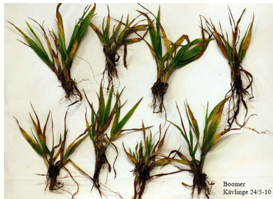
Billede 5. Planter angrebet af hvededværgvirus.

Hvede er den vigtigste vært, men rug og triticale kan også angribes i mindre omfang. I Tyskland er fundet en type, som kan angribe byg. Flere græsser, blandt andet rajgræs, kan også være vært for viruset.