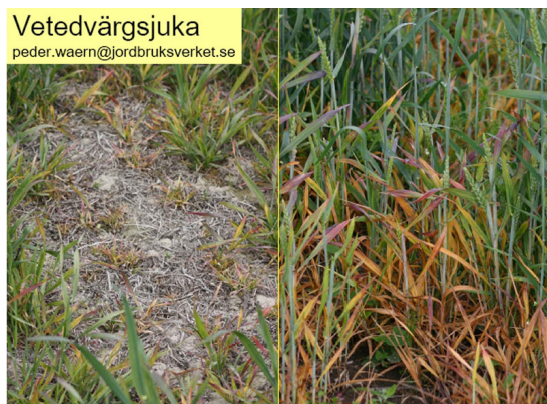
Billede 1. Dværgvækst og rødfarvede blade i vinterhvede som følge af angreb af hvededværgvirus. Jo tidligere angreb jo større skade.

Symptomerne ses oftest først ved begyndende vækst om foråret og kan forveksles med havrerødsot. Se billederne nedenfor.